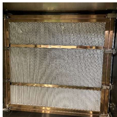
耐熱 HEPA フィルター