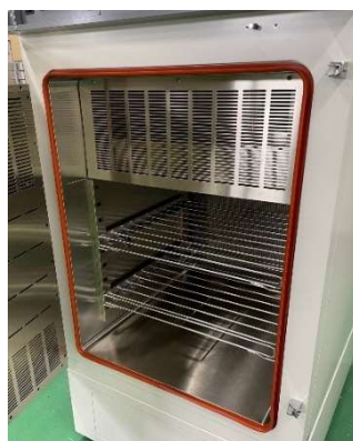
庫内 (棚下 2 枚付属)