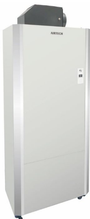
図 1 PEU02-20 外観図

SIAA マークは ISO22196 法により評価された結果に基づき、抗菌製品技術協議会ガイドラインで品質管理・情報公開された製品に表示されています。