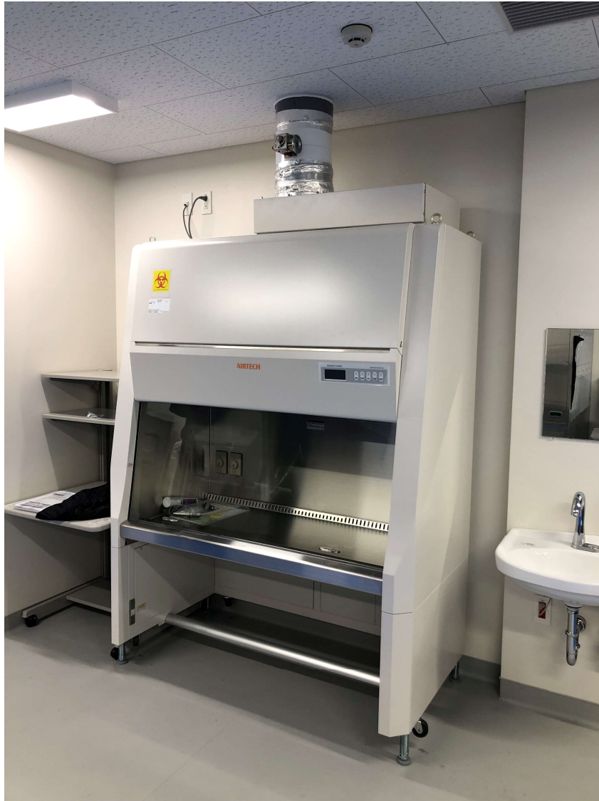
BHC-1310 II A2