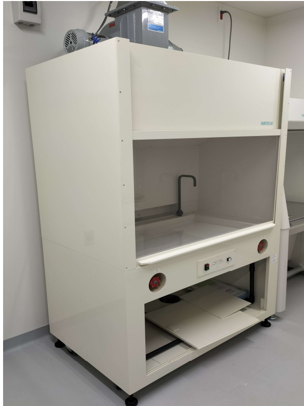
ドラフトチャンバー