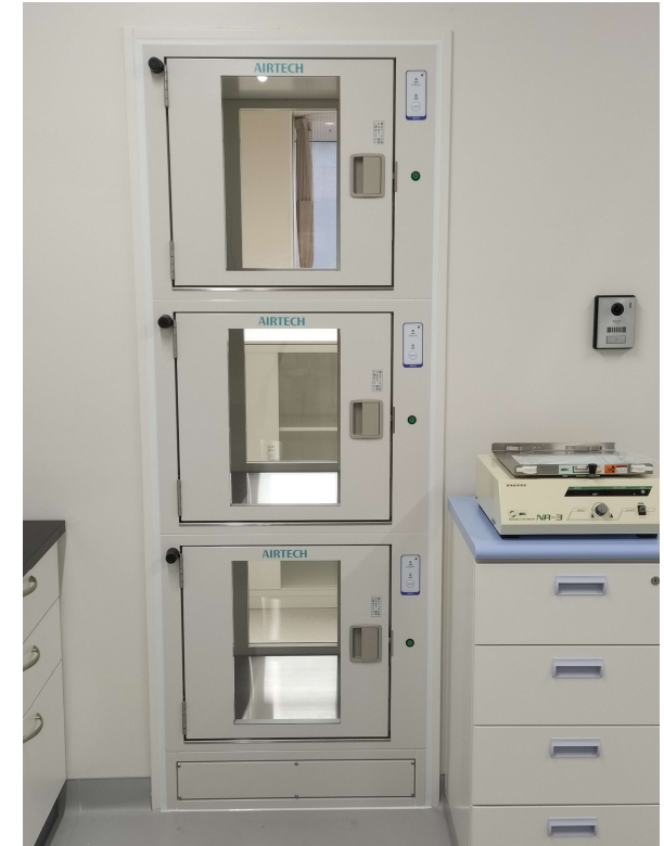
3段式パスボックス