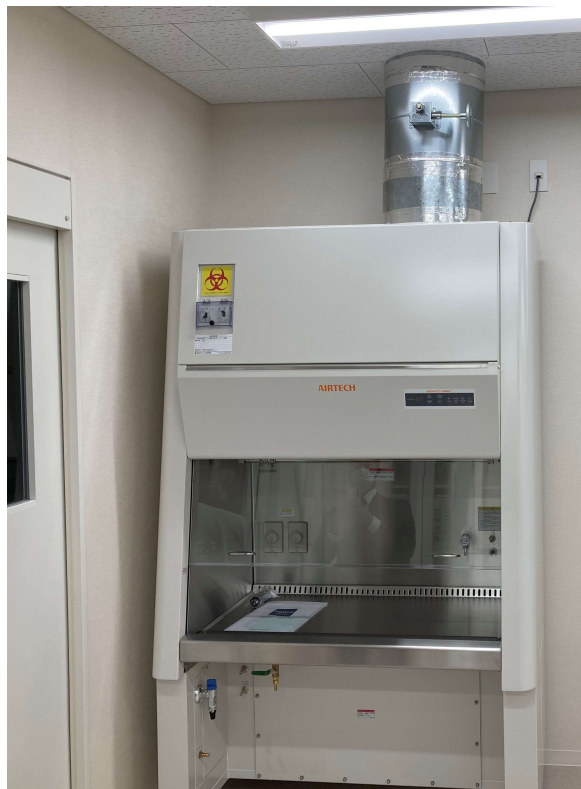
新規：BHC-1007 II B2（全排気）