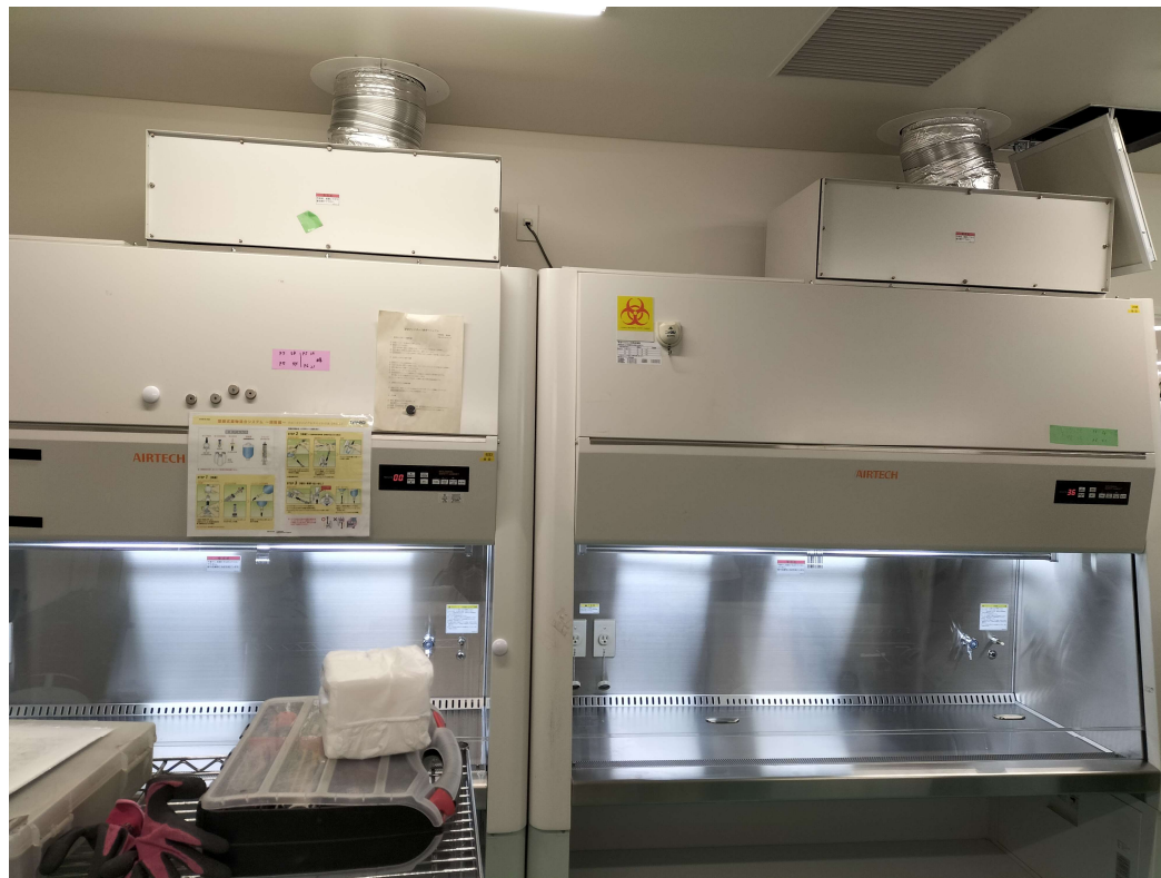
移設品：BHC-1606 II A/B3×2台