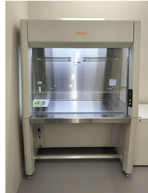
バイオクリーンベンチ