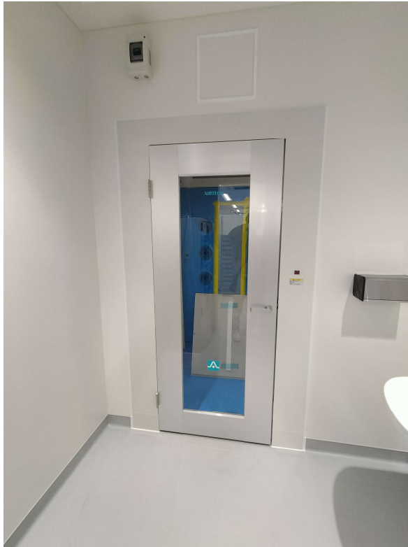
T型エアーシャワー