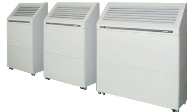
パッケージ式 クリーンユニット