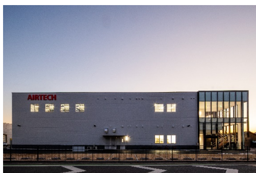
写真1 越谷工場全景