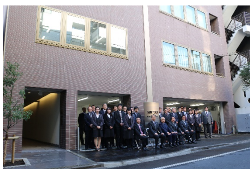
写真3 本社増築（ショールーム等）