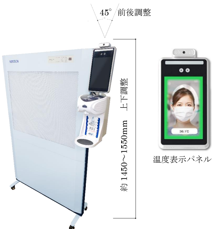
写真は ACP-897AHK-O です。

温度検知と手指消毒を非接触にて行える機能と、 背面にホワイトボードを配置しており、 特にエントランスやロビー等でのご利用に適しています。