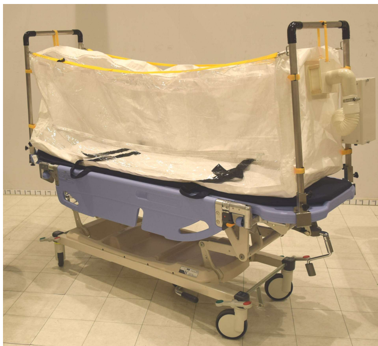
装置外観(白色フード搭載時)